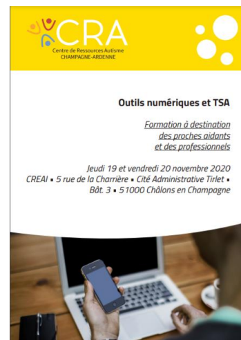
Ex. de plaquette d'information sur les formations CRA

Ces formations, adressées le plus souvent à des groupes restreint (15 personnes environ) peuvent être programmées dans les locaux du CRA mais également en différents points du territoire champardennais, sur demande.